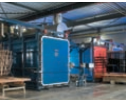
Thermic paint stripping