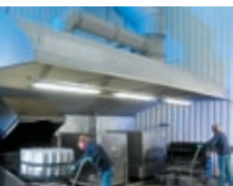
Chemical paint stripping